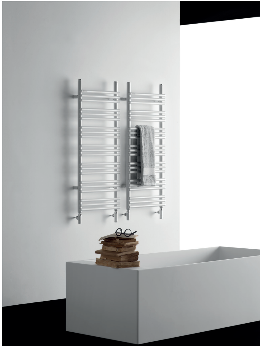
RABBIT 22 _ 105,2 x 43,5 cm _ COLOUR BCOR