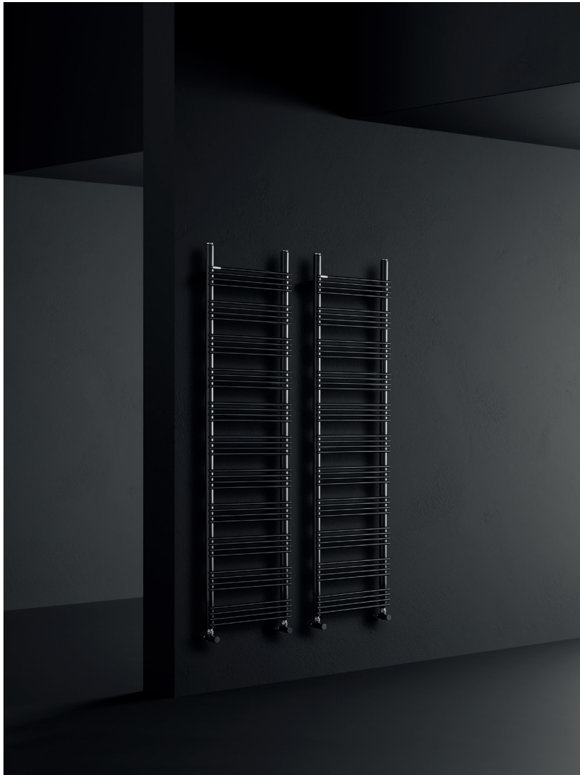
RABBIT 13 _162,8 X 43,5 cm _ COLOUR NEOP