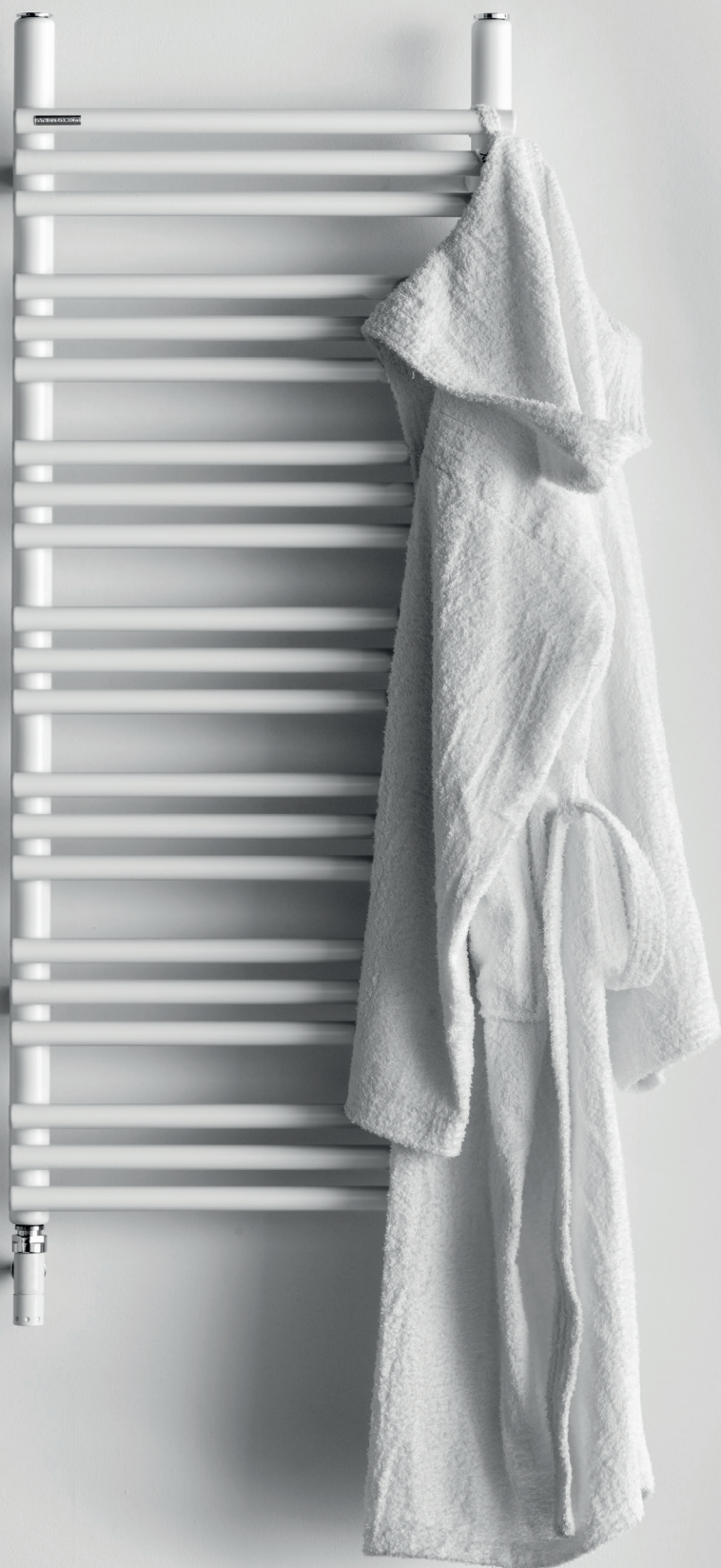
RABBIT 22 _ 105,2 x 43,5 cm _ COLOUR BCOR